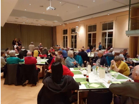
Rangverkündigung vor dem Nachtessen