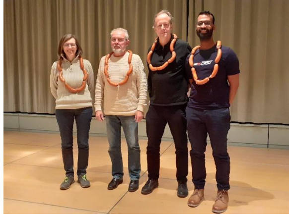
Die bekränzten Sieger der verschiedenen Gewehrtypen zusammen mit der Schützenkönigin

Vollständige Rangliste (für Trefferbild Namen anklicken!):