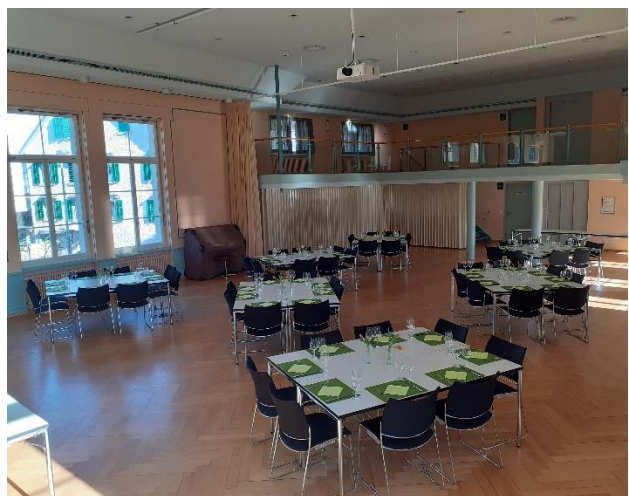
Der Hirschensaal vor dem Eintreffen der Schützen